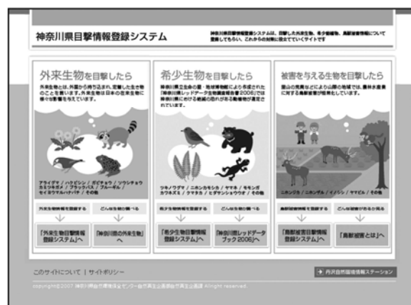
図1. 生物情報目撃登録システムのトップページ

登録システムを用いた生物情報の収集の流れを図2に示した。まず、ユーザーはそれぞれのカテゴリーの登録用HPを操作して情報を送信する(図2:a)。次に、送信された情報をWebGISサーバー上のCGIプログラムで処理し、電子メールをしてメールサーバーに