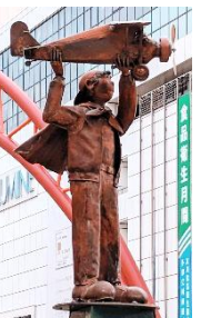
立川駅前の銅像 「風に向かって」