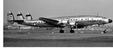
立川基地の米軍 C-124