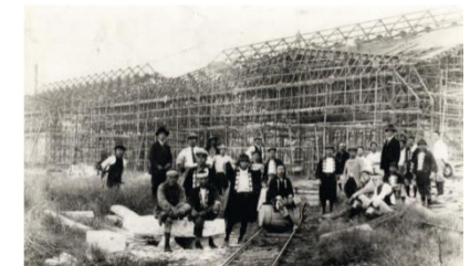
飛行場の建設風景