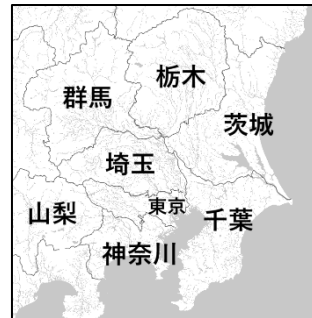
地理院地図 vector より加工